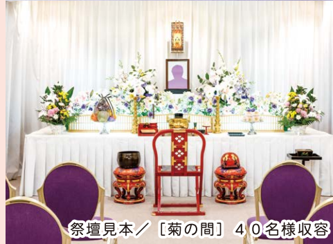
祭壇見本 / [菊の間] 40名様収容

「法要」は、故人を偲び、冥福を祈るために営むもので、死後七日ごとに四十九日まで行う「忌日法要」と、一周忌、三回忌、七回忌、十三回忌などの「年忌法要」があります。