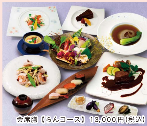
会席膳【らんコース】13,000円(税込)