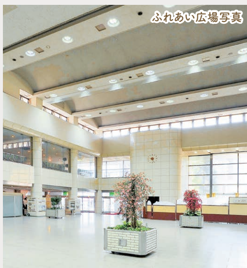
ふれあい広場写真